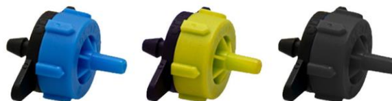
GOTERO BOTON NORMAL