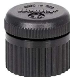
BORBOTEADOR ARBUSTO IRRITROL