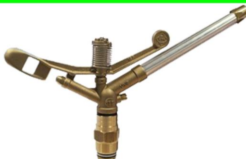
ASPERSOR IMPACTO METALICO (63 MTS. DIAM. 7 BAR)