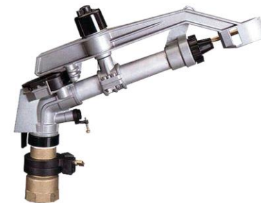
ASPERSOR IMPACTO METALICO (36 MTS. DIAM. 5 BAR)