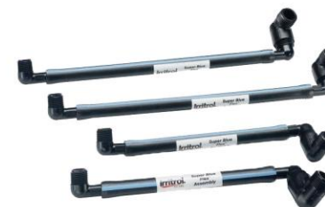
CONJUNTO BLUE FLEX (SWING JOINT) IRRITROL