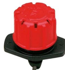
REGULABLE 0-70 L/H