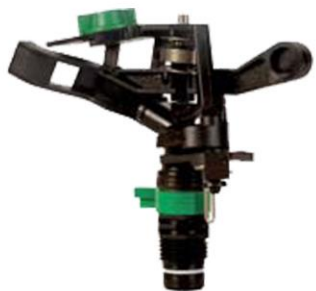
ASPERSOR IMPACTO PLASTICO (10 MTS. DIAM. 4 BAR)