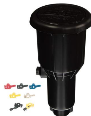
MAXI PAW IMPACTO EMERGENTE (8-10 MTS. DIAM.)