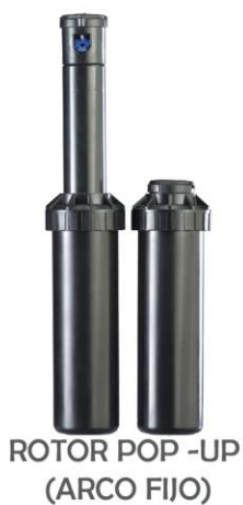
ROTOR POP -UP (ARCO FIJO)