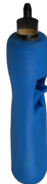
PERFORADORA DE MANGUERA