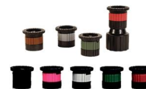
PORTA BOQUILLA IRRITROL