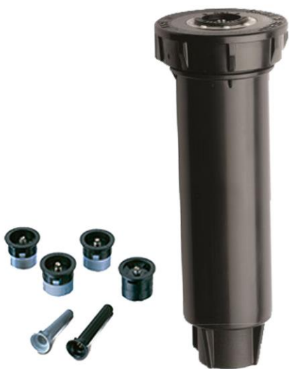
POP - UP BOQUILLA FIJA Y REGULABLE (0º A 360º)