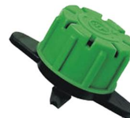
REGULABLE 0-100 L/H