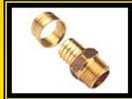
Terminal HE Pex

Medida 16 x 1/2" 20 x 1/2" 20 x 3/4" 25 x 1" 25 x 3/4" 32 x 1"