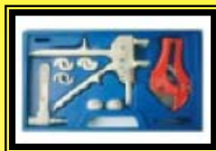
Prensa para Pex