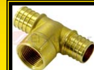
Tee con Derivación HI

Medida 16 x 1/2" 20 x 1/2" 25 x 3/4" 32 x 1"