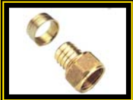
Terminal HI Pex

Medida 16 x 1/2" 20 x 1/2" 20 x 3/4" 25 x 1" 25 x 3/4" 32 x 1"