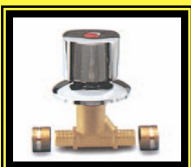
Llave de Paso Pex

Medida 16 x 1/2" 20 x 1/2" 25 x 3/4" 32 x 1"