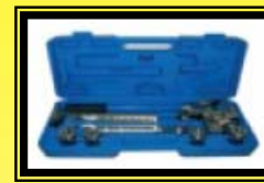
Prensa para Pex